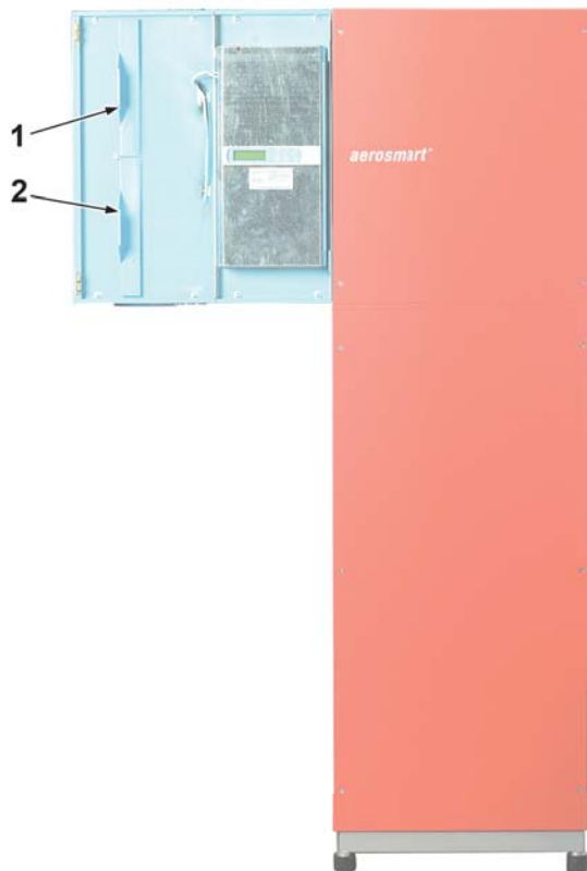
Bild: aerosmart ohne Revisions- deckel

Entnehmen Sie die verschmutzten Filtermatten.